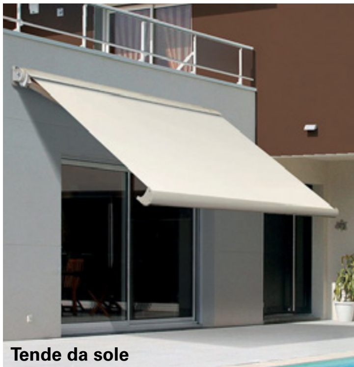
Tende da sole